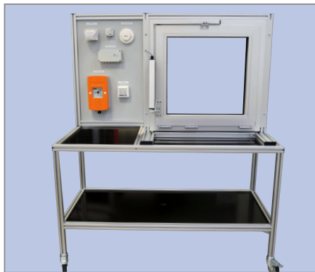
144912 - Automatische Fenstersteuerung