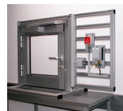
Modulsatz elektr. Türöffner