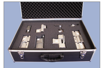
144662 - Beschläge