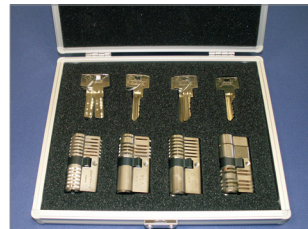
144557 - Schließzylinder IV