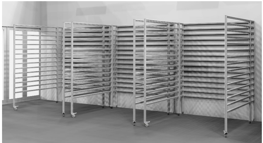
Ausführungsbeispiel einer Installationswand